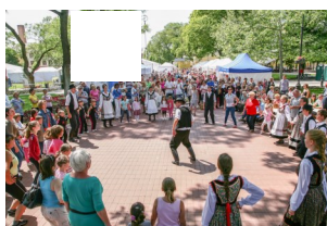
Közös tánctanulás. A tánc - a mozgás egyik lehetséges módja is- az egészségmegőrzés része