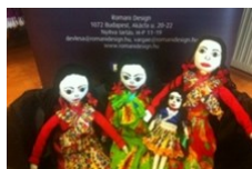
Kézzel készített babák, roma viseletben