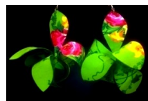
Speciális technikával készült orchidea formára emlékeztető fülbevaló - „fűlchidea” - az ékszer-kollekcióból