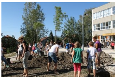
A biatorbágyi iskolában nagy esemény volt a faültetés

http://www.youtube.com/watch?v=-E9WIL2DZgo