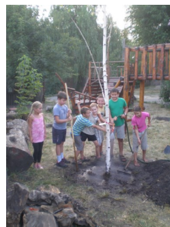
Kispesztben is beszálltak a gyerekek