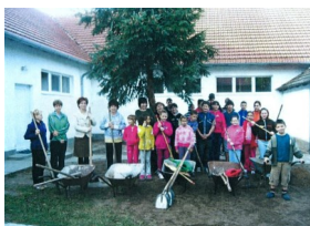
A dóci iskola zöldítő csapata

A program kezdő időpontja: 2011. május 1.