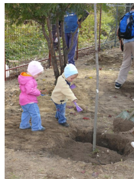
Mikepércsen a legkisebbekre is számíthattak