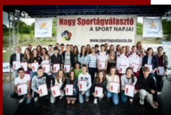
Támogatott sportolók – Sport pályázat eredményhirdetése a Nagy Sportágválasztón

Pályázati programokon keresztül támogatás nyújtása magánszemélyeknek és nonprofit szervezeteknek.