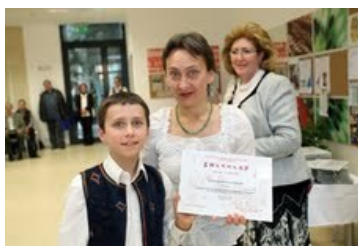
Astangajóga Alapítvány és az „Emléklap” legfiatalabb átvevője

www.budapestbank.hu/info/alapitvanyok/alap-budapest.php