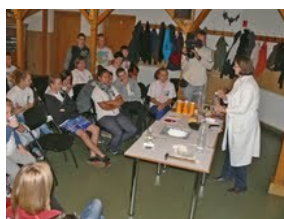
Otthon is kipróbálható kémiai kísérletek bemutatója az „Egy nap alatt a TVK körül” vetélkedőn