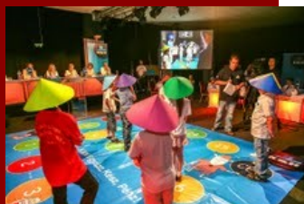
K&H „Vigyázz, Kész, Pénz” országos pénzügyi vetélkedősorozat

Az alapító K&H Bankkal együtt kerül több éve kiírásra a "K&H Vigyázz, Kész, Pénz" országos tudásverseny. Támogattuk a Mindennapi Pénzügyeink Programot, egyetemi kutatást és tankönyvírást, középiskolai oktatási eszközök beszerzéséhez nyújtottunk segítséget.