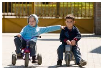
Zsadányi Református Egyházközség Családok Átmeneti Otthona