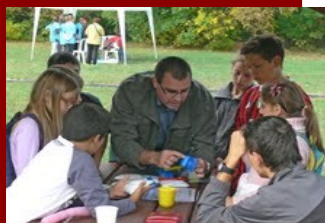
Mindennapi használati tárgyak műanyagból - iskolások ismerkedése a műanyagok fontosságával

Az alapítvány közhasznú tevékenysége: egészségmegőrzés, betegség megelőzés, gyógyító-egészségügyi rehabilitációs tevékenység; szociális tevékenység, családsegítés, időskorúak gondozása, tudományos tevékenység, kutatás, nevelés és oktatás, képességfejlesztés, ismeretterjesztés, kulturális tevékenység, kulturális örökség megővése, gyermek- és ifjúságvédelem.