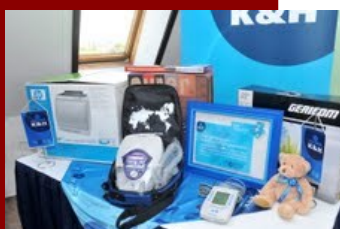
K&H gyógyvarázs Program

Az alapító K&H Bankkal együtt évenként kiírásra kerül a K&H gyógyvarázs pályázat a gyermekegészségügy területén egy-egy szűkebb gyógyítási területre fókuszálva. A pályázók részére a bírálatot követően is igyekszünk támogatásokat nyújtani pénzügyi lehetőségeink szerint. A támogatás a pályázók által megjelölt orvosi műszerek, eszközök beszerzése és részükre történő átadással valósul meg. Szintén az alapító K&H-val együtt valósul meg a tömegsport és az élsport támogatása.