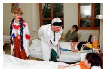
Bohócdoktorok – Bohócdoktorok a székesfehérvári kórházban bevetésen