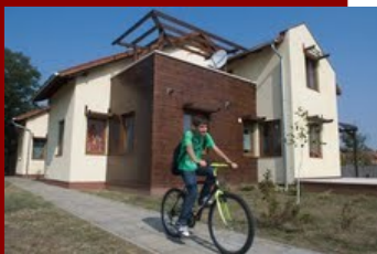
Sándorfalva, Magyarország első energiatakarékos és környezetudatos építészeti megoldásokkal épült bérlakása

Hazánkban a bérlakás állomány jóval az uniós átlag alatt van. Az Alapítvány célkitűzése, ennek a hátránynak a behozása, az esélyegyenlőség megteremtése, a mobilitás, a munkahelyhez közeli letelepedés biztosítása, növelése, a helyi közösség számára fontos szakemberek (orvosok, pedagógusok) letelepedésének a támogatása. Az alapítvány 2005-ös alapítása óta egy 25 fős anyaotthon megvalósulását támogatta, 157 családnak teremtett új otthont, és 500 ember életkörülményei javultak.